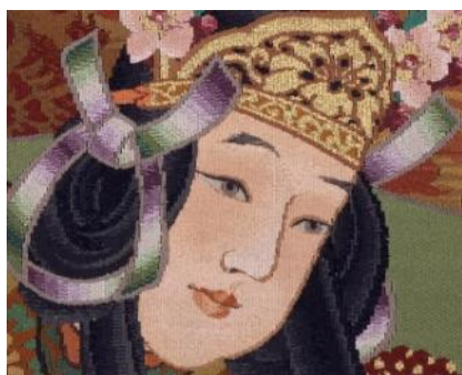
綴織壁掛 試織「舞楽蘭陵王童舞」(部分)