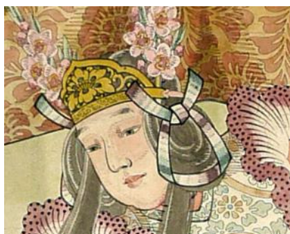
綴織壁掛 織下絵「舞楽蘭陵王童舞」(部分)