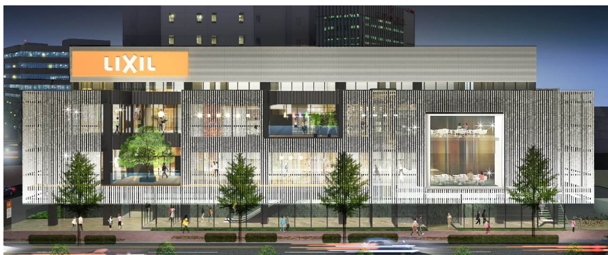
夜間における建屋外観のイメージ