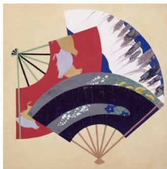
紫雲閣綴織格天井原画 「扇散らし日本名所之図」より (磐城乙字ヶ瀧 陸前宮城野のうづら)