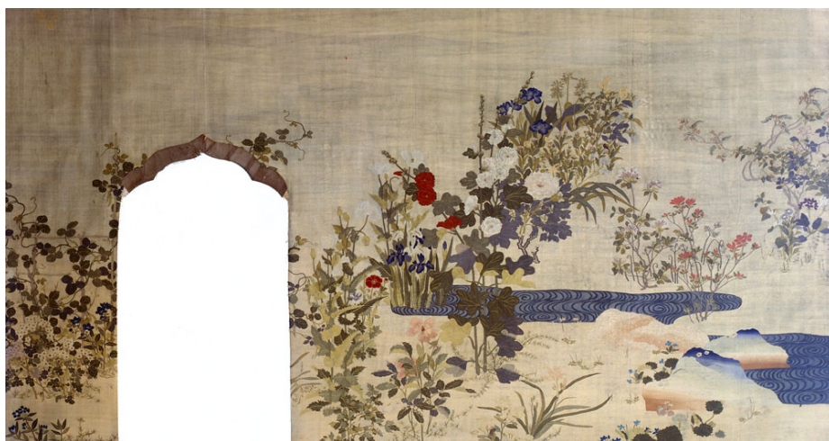
川島織物参考館 綴織壁張「光琳四季草花」