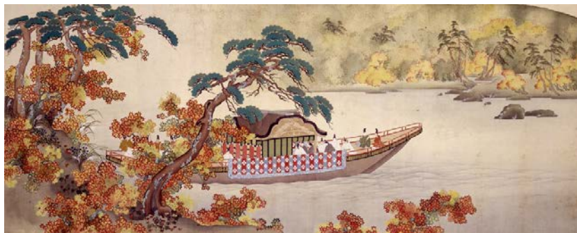
日光丸談話室綴織パネル原画 「嵐山三船祭」(船一艘)

※作品は四半期ごとに展示替えを行います。(展示内容については事前にお問い合わせ下さい)