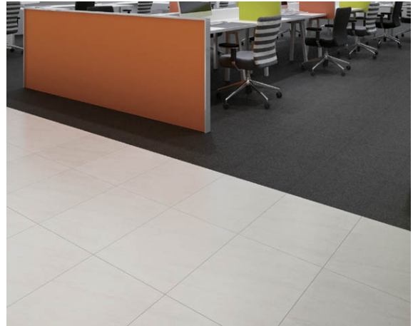
ビニル床タイル 「リファインバックエグザ」