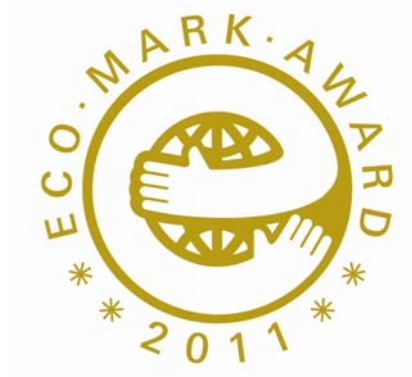
「エコマークアワード 2011」受賞ロゴ

川島織物セルコンは、持続可能な社会の形成に向けて、これからもエコマーク認定商品の開発と普及により、環境配慮を進めていきます。