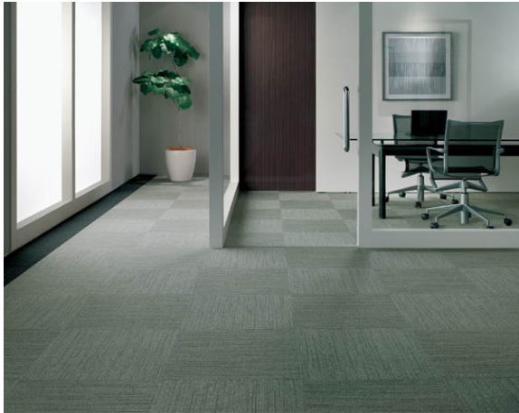
タイルカーペット 「アートバンク/カラーバンク」