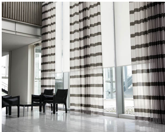
オーダーカーテン 「フェルタ」「プルミエ」