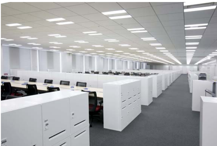
施工例 (当社東京支店)

京都議定書の締結された京都に本社を置く企業として、この取り組みを皮切りに今後も環境重視の経営を進め、温暖化防止に貢献していきます。