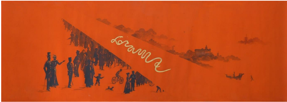
刺繍 引幕 墨帳 原画「Dream」海外天年（明治中後期頃）

株式会社川島織物セルコン（本社：京都市左京区 社長：光岡 朗）は、本社併設の川島織物文化館（京都市左京区）で、創業 180 周年特別企画「さあ、幕あけの時 大舞台を彩る緞帳」展を7月3日（月）より開催します。