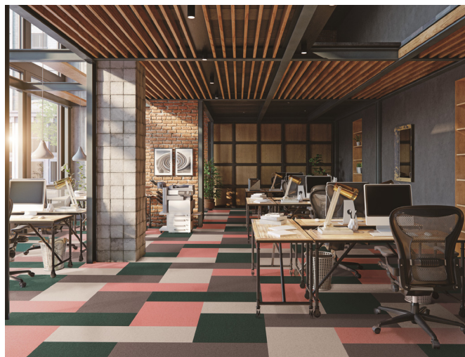
サキソニーエコ / AB1300