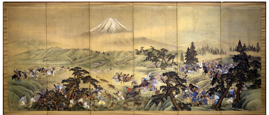
綴織壁掛 原画「富士巻狩(左隻)」今尾景年筆

明治宮殿は第二次世界大戦の空襲にあい消失してしまったため、資料があまり残されていません。宮殿を知りたいへん貴重な資料と川島織物のモノづくりを是非ご覧ください。