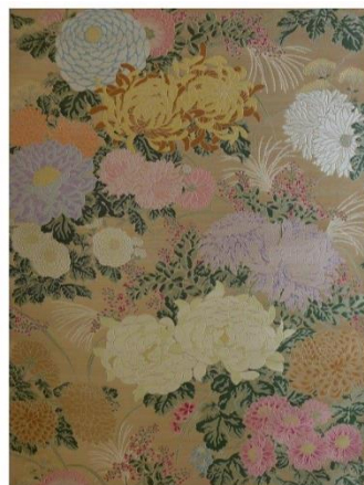
左:正殿 紋織緞帳「鳳凰に唐草模様」 下絵 右:牡丹之間(婦人室) 紋織緞帳「秋草紋様菊花之図」 試織