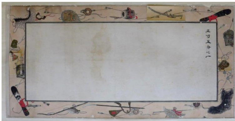
西溜之間 綴織壁掛「富士卷狩」 輪郭小下絵