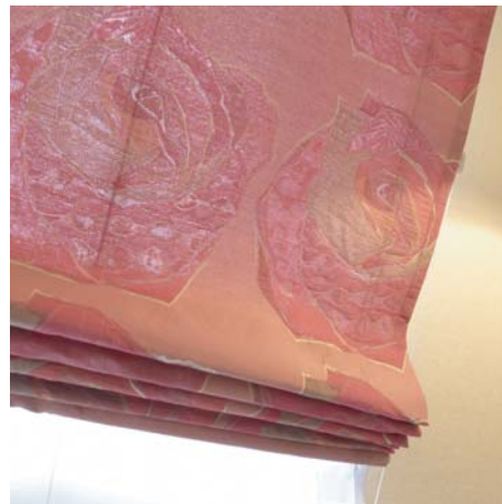
花を添える added flowers

一人のデザイナーの前衛的な創作活動が作り出すオリジナリティと美しさで圧倒するSumiko Honda 2007.