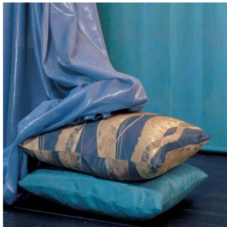
流れにのせて beyond the flow

Sumiko Honda は 5つのカテゴリー142アイテムの全商品を出展します。