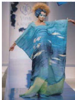
wedding dress fabric

株式会社川島織物セルコン Kawashima Selkon Textiles Co.,Ltd. 265 Ichihara-Cho, Shizuichi, Sakyo-ku, Kyoto 601-1123 Japan http://www.kawashimaselkon.co.jp/