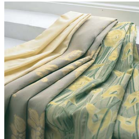
生命力を感じる植物たち Living plants

「花を添える」を代表する商品の一つ「ボッチョーロ」は、その豪華なテクスチャーと色が、見る角度や照明により変容します。