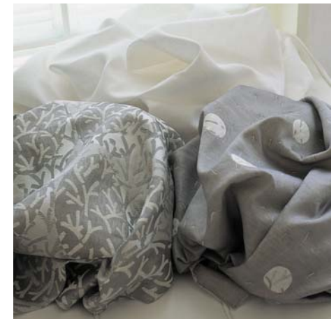
image 円 image of Circle

「生命力を感じる植物たち」は、陰影や光の角度により、ファブリックのドラマチックな印象が異なります。